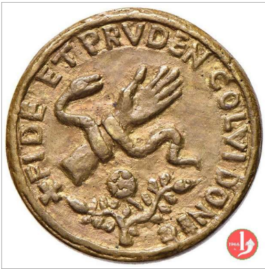
Abb.8: Medaille „Virgilius Rosariivs Car De Spoleto“, Rom 1558 / Durchmesser ca. 35mm; Material: Bronze 15

Ein weiteres Exemplar, in Silber ausgeführt, befand sich einem Bericht aus dem Jahr 1781 zufolge seinerzeit im Münzkabinett des Klosters St. Blasien. 16