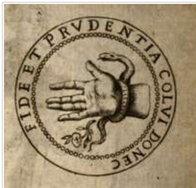
Abb.4: Das Siegel in Le memorie bresciane von Ottavio Rossi (1616). Auffällig ist im Vergleich zum Siegel Aeschers die abweichende Schreibweise des Mottos, die merkwürdige Stellung der Finger und das Fehlen des Kreuzes – zudem zeigt Rossis Darstellung eine rechte Hand, Aeschers Siegel eine linke Hand.

In dem Buch findet sich eine Abbildung, die dem Siegel Aeschers schon sehr nahe kommt: