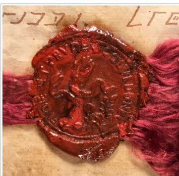
Abb.1: Foto von Aeschers Siegel aus den Eckleff'schen Akten