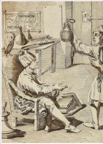
Abb.12: Baron Philipp von Stosch als Kunsthändler und Mäzen auf einer zeitgenössischen Zeichnung des römischen Karikaturisten Pier Leone Ghezzi

Hier lernte er von Stosch kennen, der dort (ungeachtet dessen, dass seine Abenteuer mit den Stuarts in Rom inzwischen hinter ihm lagen) eine mehr als schillernde Persönlichkeit war: von Stosch war ein Archäologe, Kunsthändler, Mäzen und Antikensammler, der für seine umfangreiche Münz- und Medaillensammlung (!) bekannt war. 44