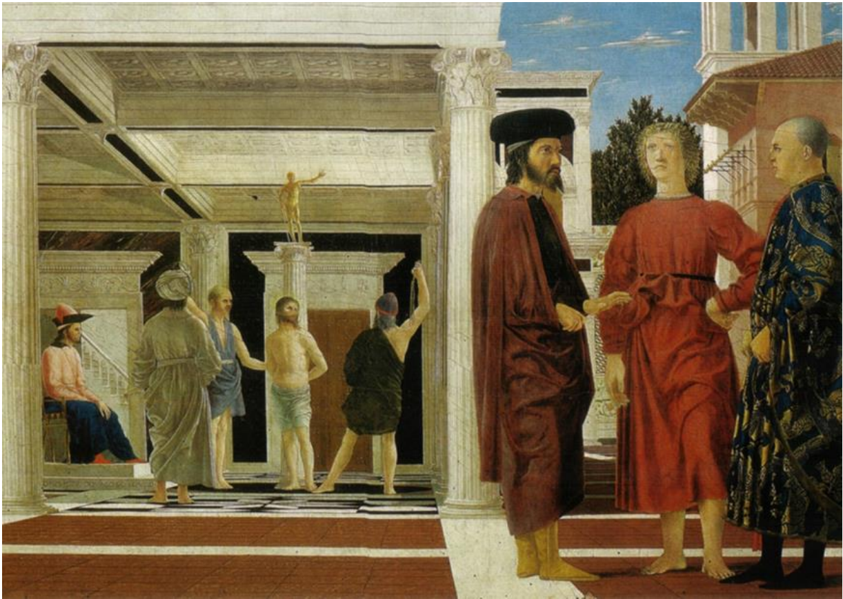
Piero della Francesca, Flagellazione di Cristo (1453 circa)

Eine der über 35 gegebenen wissenschaftlichen Deutungsvorschläge zu diesem Bild ist, dass der junge Mann in rot, rechts, Marsilio Ficino darstelle. Nun: Mir fällt auf, dass die „Geißelung Christi“, im linken Bildfeld, an einer Säule mit einer Zeus/Apollo Statue stattfindet, was mich an die Makkabäergeschichte erinnert. Sollte es in Italien etwa eine Bruderschaft gegeben haben, die sich darauf bezog, könnte ich mir vorstellen, dass die Spur vielleicht zu Ficino verliefte.